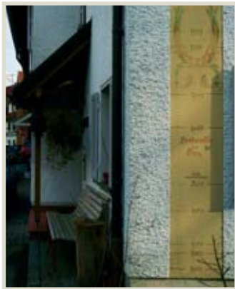
Hochwassermarkierungen am Haus Enzgasse / Brunnengasse am "Kleinen Törl"