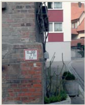
Hochwassermarkierungen am Haus Untere Gasse / Brunnengasse