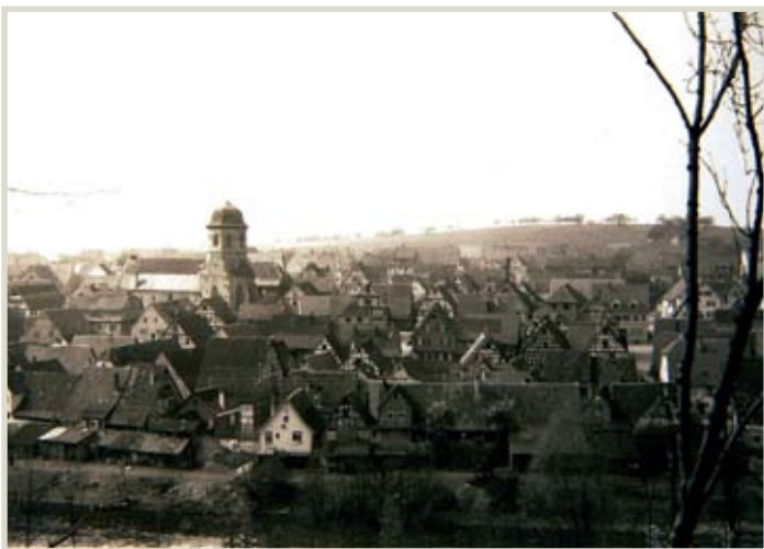
Oberriexingen ohne Hochwasserdamm, fotografiert vom Enzblick aus

Dr Schwan der baut a Nest für seine Jonga, on sogar Nutria senn jetzt bei ons ókomma. Früher dó war des no a bissle anders, wo nó koi Hochwasserdamm isch gstanda dó isch mr zom groBa Törle naus, nó isch Enz vor euhm gwä, - a, richtiger "Augaschmaus".