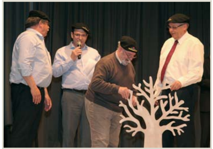
Verbrüderung an die Jugend weitergetragen werden müsse.

Dieser bedankte sich für die bewegenden Momente beim Vortrag der beiden National-