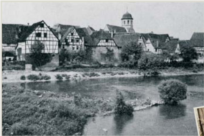
Der malerische Winkel von Oberriexingen

Ganz gemächlich plätschert se am Städtle vorbei onser Enz, dui ghört zu onserem Leba. Em Sommer stehan a paar Angler am Ufer, on a Schiffla läst sich abwärts treiba.