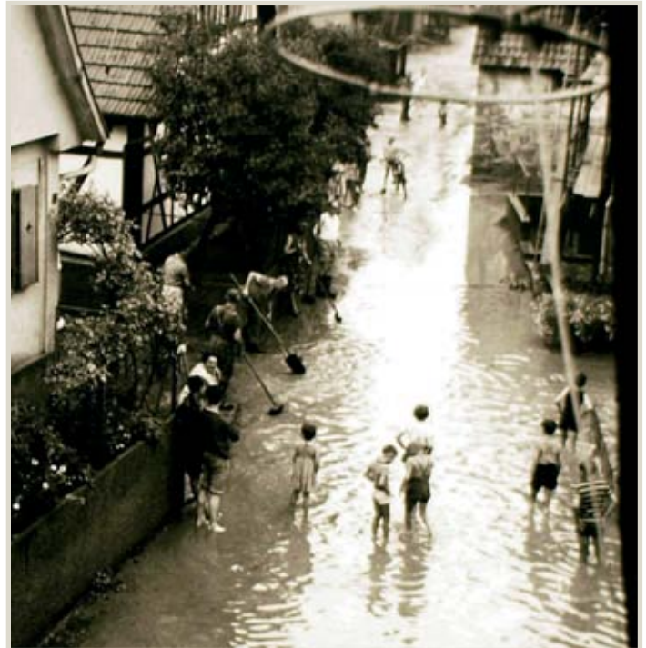
Nach dem Hochwasser ist große Kehrwoche angesagt, links Haus Nr. 26 und 24

Jetzt isch gfeht worda putzt ón gspritzt, solang bis alles sauber isch. Mitghoffa hat do Kend on Kegel, denn des isch bei ons em Hafaviertel so dui Regel.