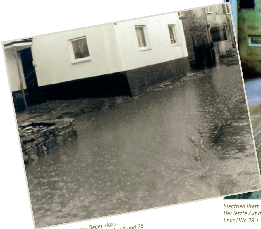
Hochwasser und noch Regen dazu, in der Untren Gasse, links Haus Nr. 27 und 29