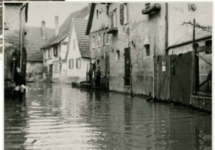
Unbekannt, Uli Brett, Klaus Haueise vor Haus Nr. 29 Ohne Boot ist fast kein weiterkommen, Untere Gasse